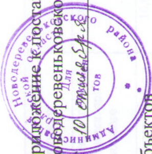
Схема размещения нестационарных торговых объектов на территории Новодеревеньковского района Орловской области на 2018 год